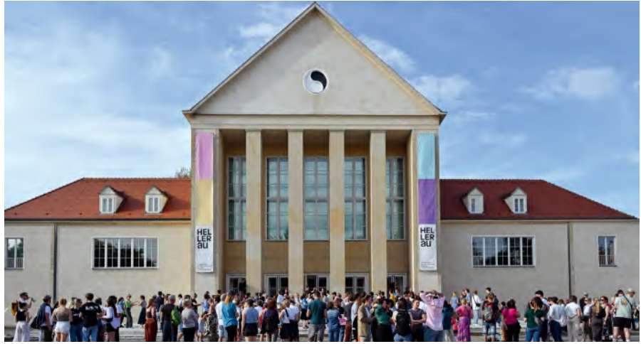
Festspielhaus Hellerau.