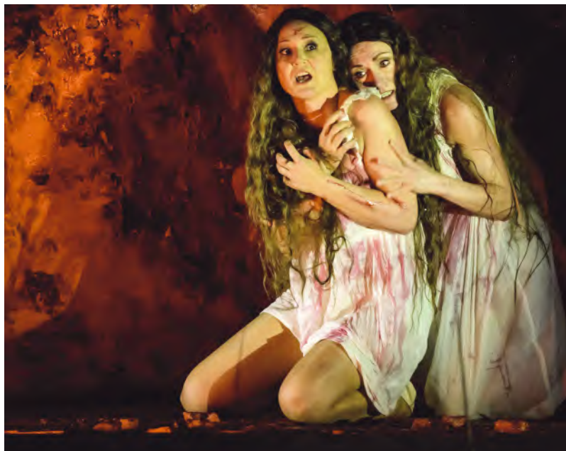
Pascal Dusapin, „Penthesilea“ an der Staatsoper Hannover.