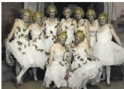
Divertissementchen 1946.

Deutscher Bühnenverein und DEUTSCHE BÜHNE veröffentlichen im Themenheft „Daten-Theater“ Beiträge, Interviews und Grafiken über Theaterstrukturen, Repertoires, Besuchszahlen, Arbeitsweisen, historische Entwicklungen und aktuelle Daten. Unter anderem wird erläutert, welchen Nutzen die Unterscheidung von Theater- und Werkstatistik für Theater, Forschung und Kulturpolitik hat. Anlass der Publikation ist der Start des neuen Theaterstatistikportals des Deutschen Bühnenvereins, über das die Theater ihre Daten eingeben können. Das kostenlose digitale Sonderheft zeigt, wie die Auswertung von Statistiken die Theaterlandschaft und ihre Entwicklungen beschreiben kann: www.die-deutsche-buehne.de/hefte/themenheft-daten-theater/