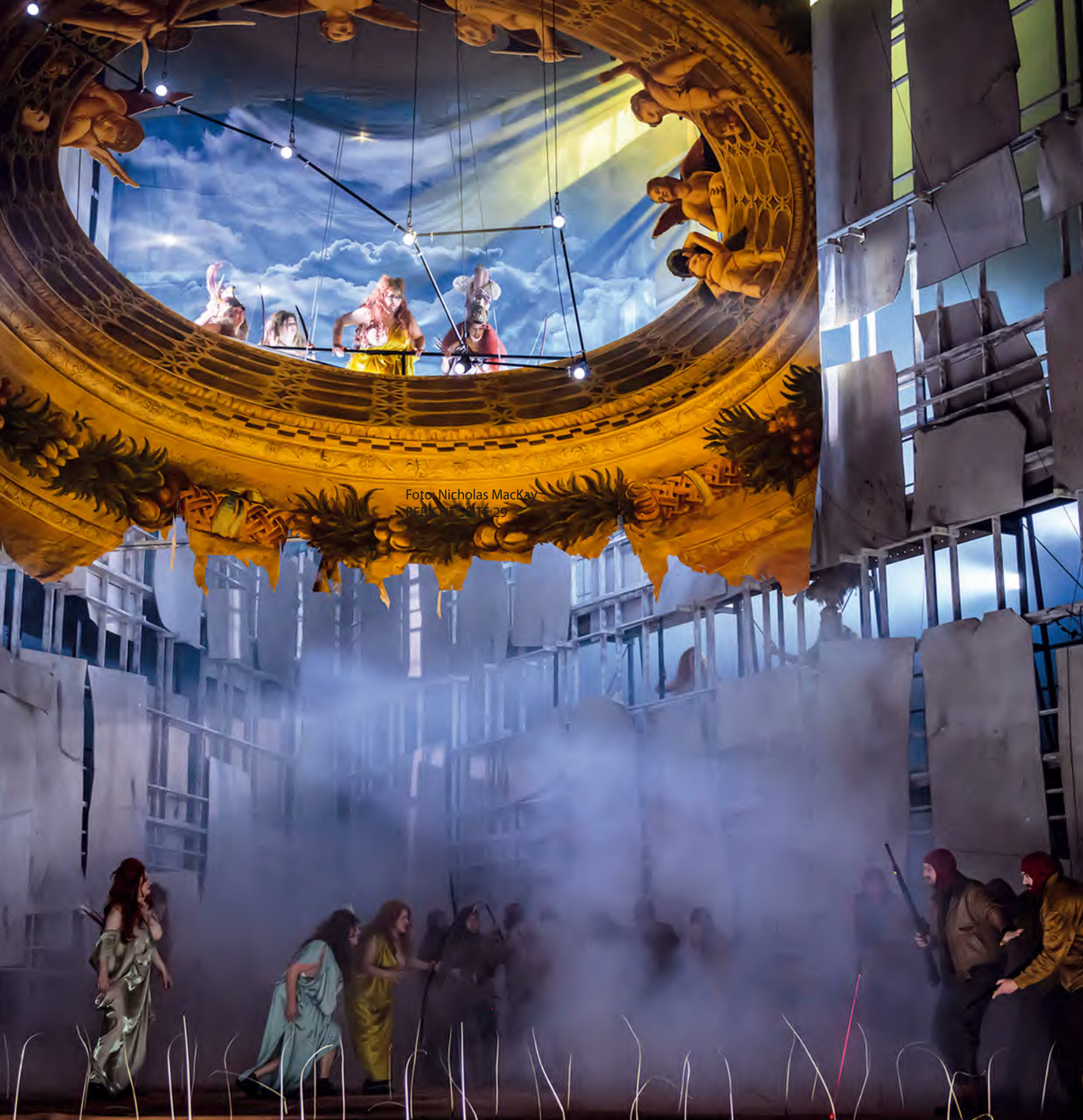
BERICHT SEITE 29