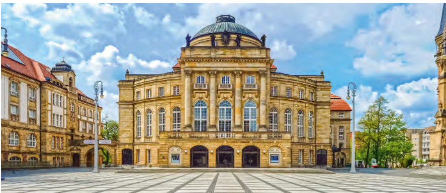
Oper Chemnitz.

Seit April 2025 erhalten die TV-L Beschäftigten des Landes Berlin aufgrund eines entsprechenden Tarifvertrages mit der ver.di die sogenannte „Hauptstadtzulage“. Die NV Bühne-Gewerkschaften hatten ebenfalls zu deren Übernahme verhandelt, bis der DBV ihnen mitteilte, dass die Beschäftigten nach NV Bühne diese – weder bei den Bühnen des Landes Berlin noch bei der Stiftung Oper – erhalten sollen. Seitdem weigert sich der DBV mit verschiedenen Argumenten entsprechende Verhandlungen aufzunehmen. GDBA, VdO und BFFS haben sich daher nun entschlossen nicht länger abzuwarten und gemeinsam eine Feststellungsklage nach § 9 Tarifvertragsgesetz zu erheben, dass sie einen Anspruch auf sinngemäße Übernahme nach § 12a NV Bühne haben. In dem Zusammenhang hat die VdO ihren Mitgliedern der Ortsverbände an der Stiftung Oper in Berlin im letzten Monat Schreiben zur Geltendmachung der Hauptstadtzulage zur Verfügung gestellt, um diese an ihren jeweiligen Häusern abzugeben und ihre Ansprüche zu sichern.