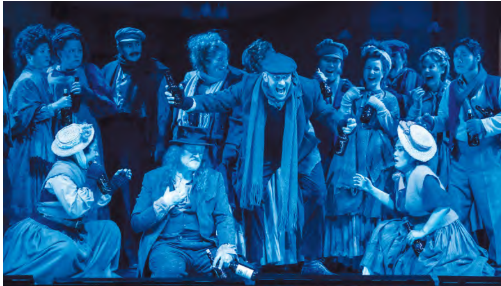
Phyllis Tate, „The Lodger“ mit dem Opernchor der Wuppertaler Bühnen.