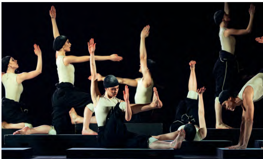
„Cacti“ mit dem Ensemble, Ballettfestwoche 2026 des Bayerischen Staatstheaters München.

Aus dem Nebel tauchen vier Musiker mit ihren Streichinstrumenten auf. Köpfe lugen hinter weißen Podesten hervor. Darauf legt die Kompanie rhythmisch los wie ein Wirbelwind, der sich in geordnetem Chaos in alle Richtungen verbreitet. Atem ist zu hören. Man ruft und lacht. Jeder klopft sich selbst lautstark ab. Arme werden zu Schlegeln. Stachelige Kaktus-Requisiten tauchen auf. Schauereffekt und Wirkung sind grandios. Mit einer gehörigen Portion Witz und Sarkasmus nimmt zu Beginn Ekmans „Cacti“-XL-Fassung